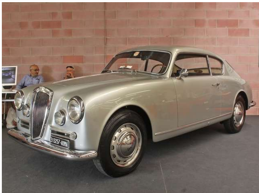
La B20, l'un des grands classiques de l'automobile italienne des années 1950

Pas plus de 860 des 3 871 exemplaires du coupé B20 produits de 1951 à 1958 disposeront de la conduite à gauche. Le levier de vitesse est installé sur la colonne de direction et deux gros compteurs creusés dans le tableau de bord suffisent à informer le conducteur sur le fonctionnement de la mécanique qui brille par son originalité.