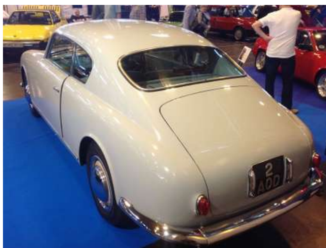
Avec la B20, Lancia a collectionné les succès en compétition.

Destinée aux esthètes, l'Aurelia est dotée d'un V6. Un choix franchement novateur à l'époque. En effet ce V6 ouvert à 60° est le premier à être monté en série après de longues études menées par l'ingénieur de Virgilio. Sa cylindrée d'abord fixée à deux litres pour 75 ch sera portée par la suite à 2,5 litres et développera jusqu'à 118 ch. La firme NARDI proposera aux amateurs des accessoires pour améliorer les performances : levier au plancher, carburateurs spéciaux etc.